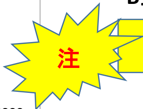
B型以外の肝炎感染者数